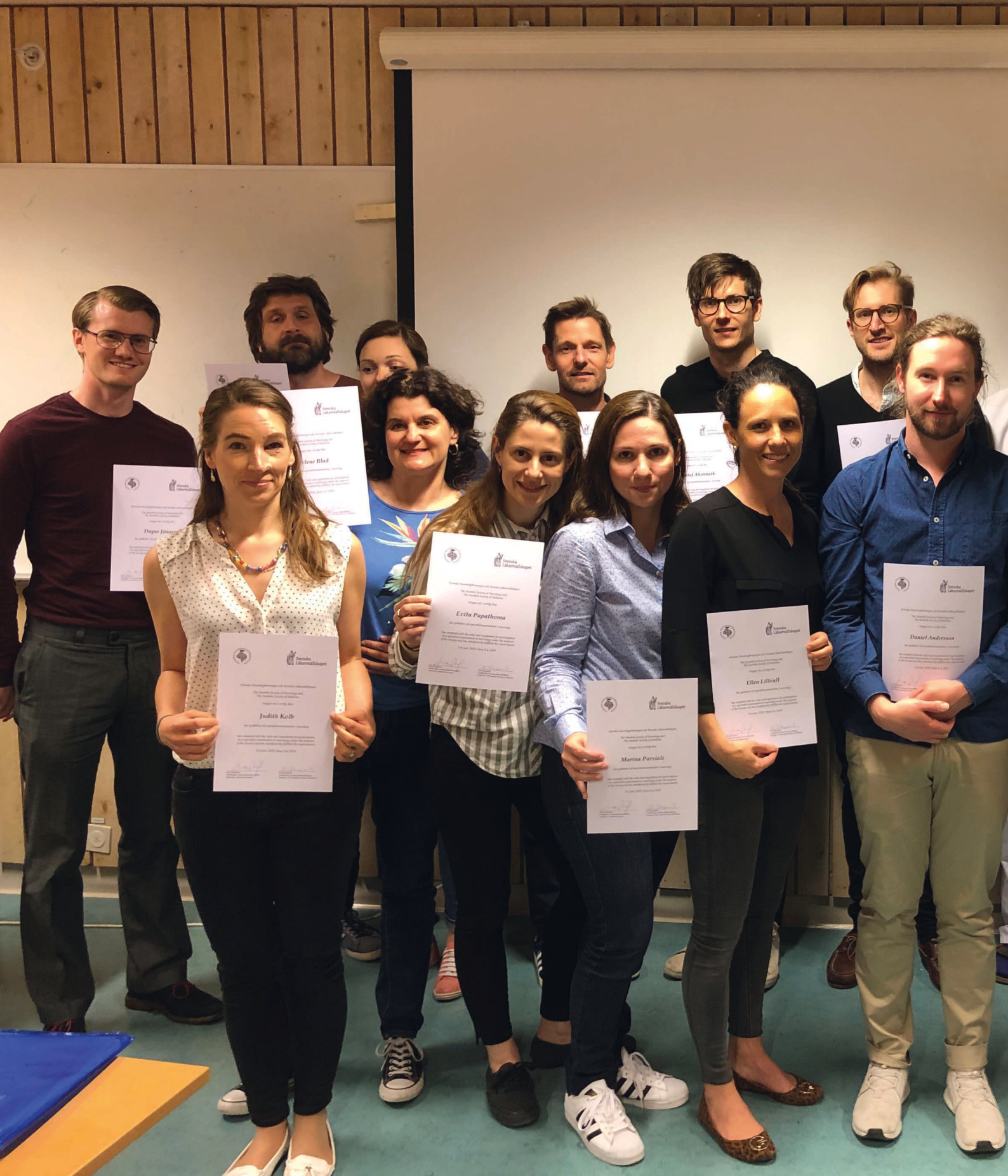
Examinander med diplom efter specialistexamen i neurologi.